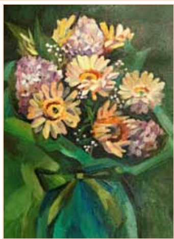
№ 33 Морозова С.Н. Герберы. К.м. 30x40, 6 000 руб.