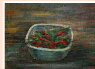
№ 13 Проценко И.Ю. Перчинки. Х.акрил 25x35, 10 000 руб.