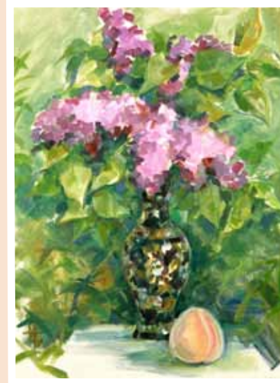
№ 42 Бунькова Н. Весенняя мозаика. Х.м. 50x40, 10 000 руб.