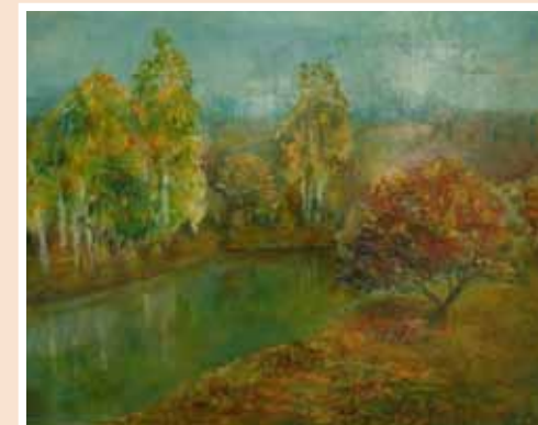
№ 25 Тимошенко А. Осень. Х.м. 50x60, 20 000 руб.