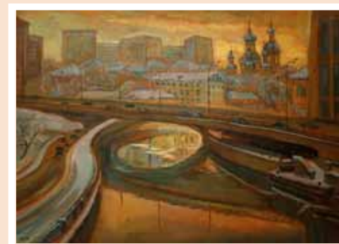
№ 7 Макаренко М.К. Лефортово. III кольцо. Река Яуза. Х.м. 45х60, 20 000 руб.