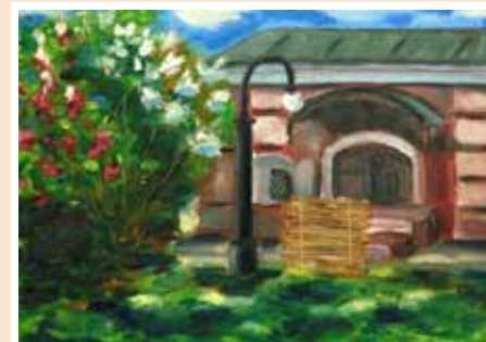
Чхеидзе Муза, Без названия. К.х.м. 25x35, 2 000 руб.