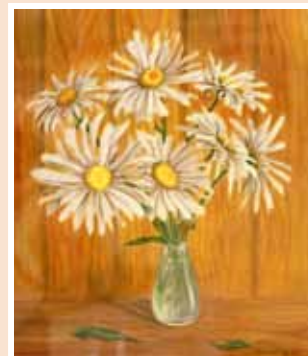
№ 30 Федотова О.Ю. Ромашки. Бум.акв. 38x34,5, 8 000 руб.