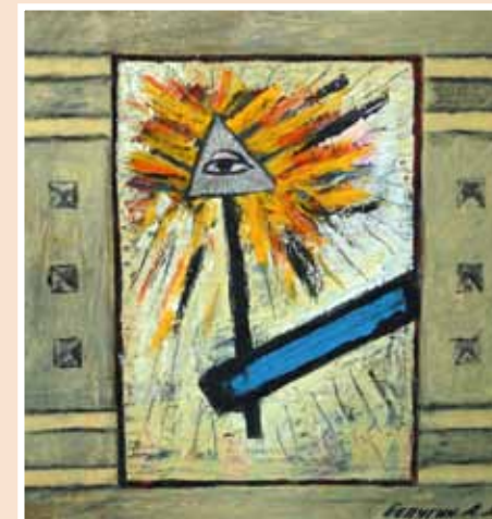
№ 12 Белугин А.Л. Всевидающее око. 1 ч. триптиха. Орг.м. 70x65, 30 000 руб.