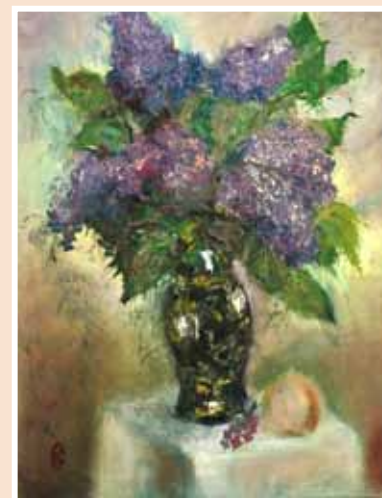
№ 5 Весна Симич. Сирень. Х.м. 50х60, 18 000 руб.