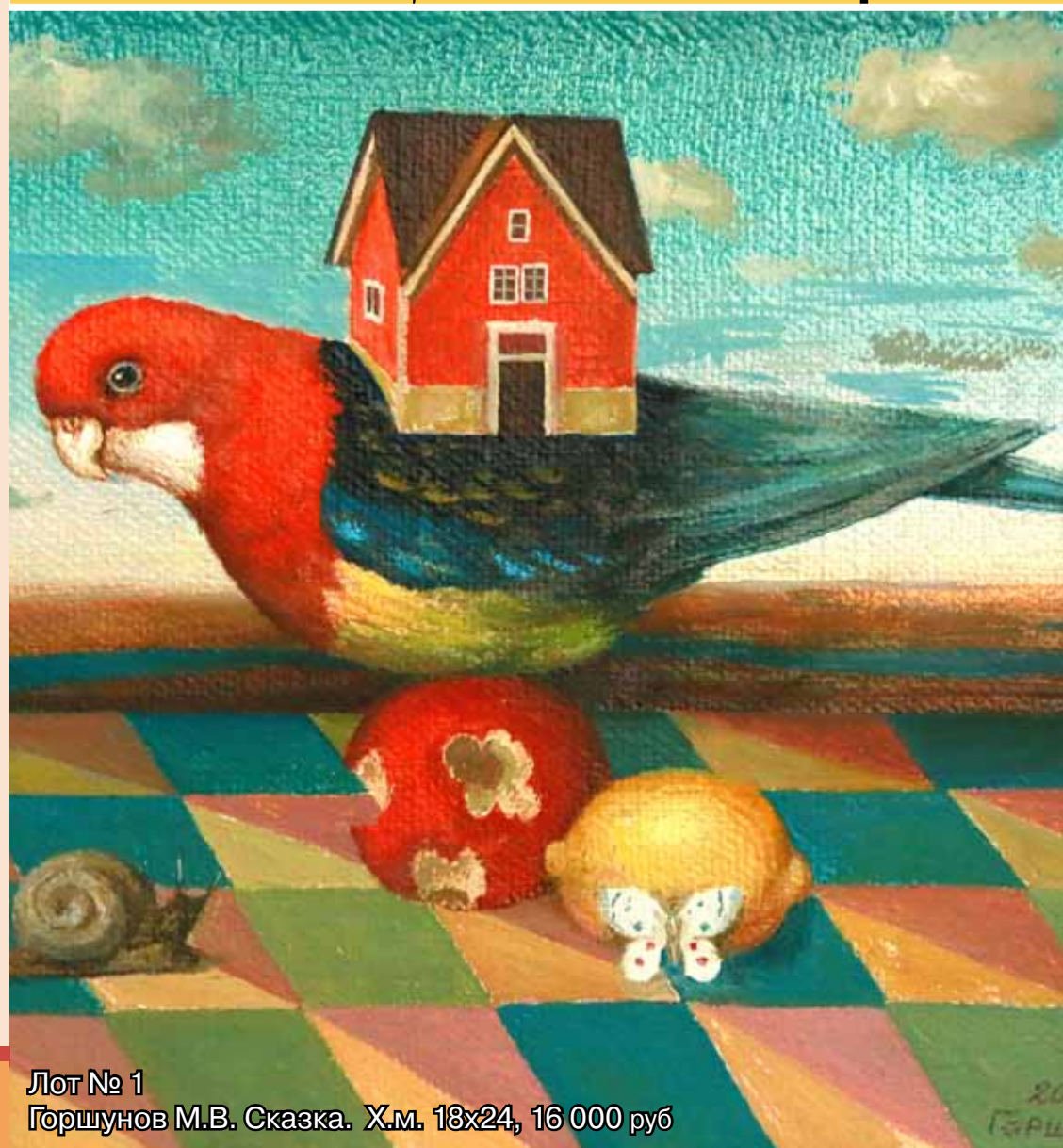
Лот № 1 Горшунов М.В. Сказка. Х.м. 18x24, 16 000 руб

в пользу ДЕТСКОГО ДОМА Николо-Перервинской обители в Печатниках