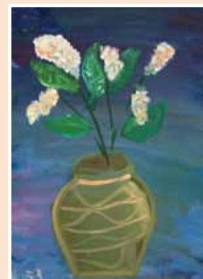
№ 32 Козлова Мила (7 лет), Белая сирень. К.х.м. 40x30, 2 000 руб.