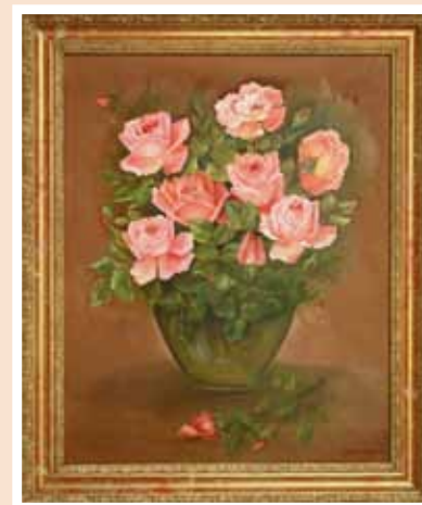
№ 37 Андреева С.А. Розы. Х.м. 50x40, 30 000 руб.