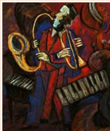
№ 9 Дмитриева Е.Н. Музыканты. 2. Бум.пастель 50x40, 10 000 руб.