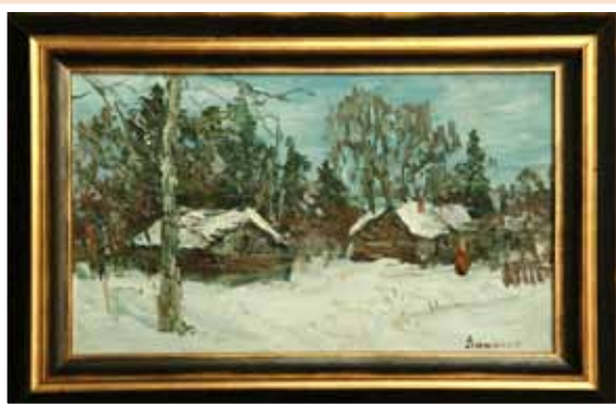
№ 35 Ямщиков В.Е. З.х.РФ, Деревня в лесу. К.м. 20x30, 20 000 руб.