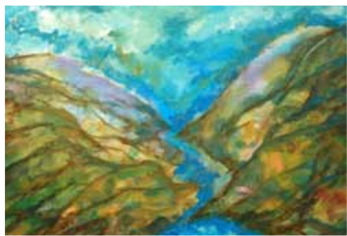
№ 39 Веденькина Л. Ущелье. К.х.м. 30x40, 4 000 руб.