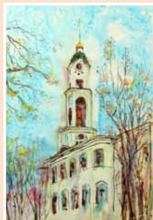
№ 21 Волхонская Л.А. Колокольня Саровской пустыни. Бум.акрил, тушь 50x40, 25 000 руб.