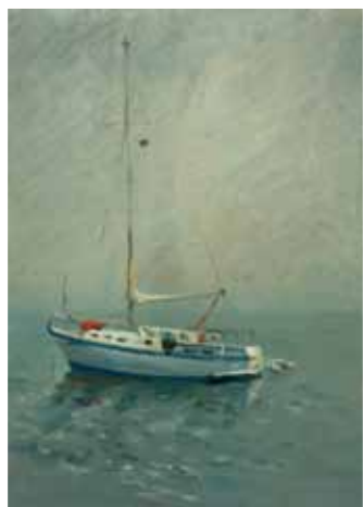
№ 2 Постников С. Яхта «Арбус» в тумане. К.м. 48х34, 26 000 руб.