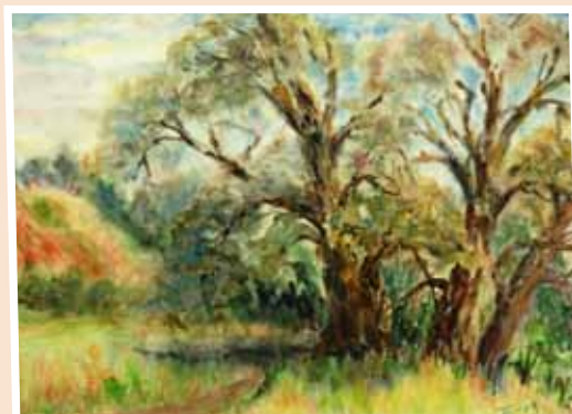
№ 22 Баукова Т.В. Ивы. Бум.акв. 40x50, 9 000 руб.