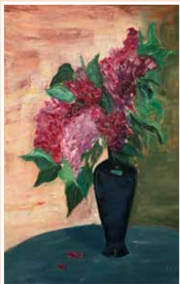
№ 20 Прянишникова Е. Запах сирени. Х.м. 70x50, 9 000 руб.