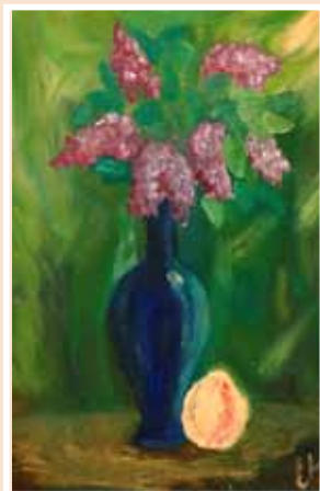
№ 40 Еригина Е. Весеннее настроение. К.х.м. 35x25, 2 000 руб.