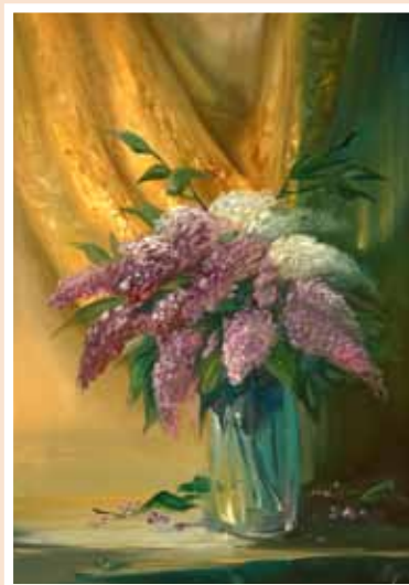
№ 34 Горемыкин Олег, Натюрморт с сиренью. Х.м. 70x50, 50 000 руб.