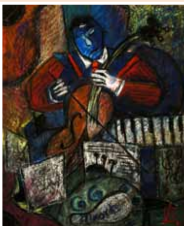
№ 10 Дмитриева Е.Н. Музыканты. 3. Бум.пастель 50x40, 10 000 руб.