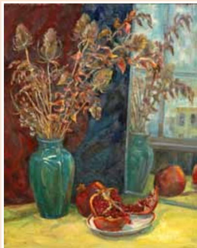
№ 26 Кулешова А.С. Осенний букет. Х.к.м. 50x40, 22 000 руб.