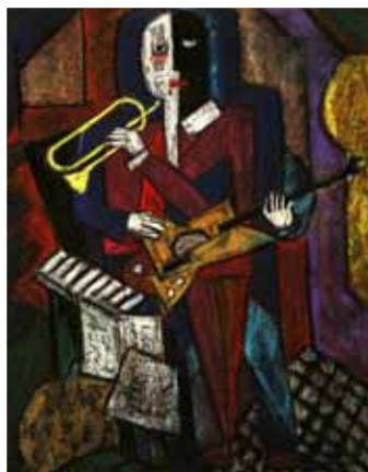
№ 8 Дмитриева Е.Н. Музыканты. 1. Бум.пастель 50x40, 10 000 руб.