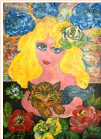
№ 27 Ладейщикова И.А. Девочка с кошкой. К.м. 50x37, 20 000 руб.