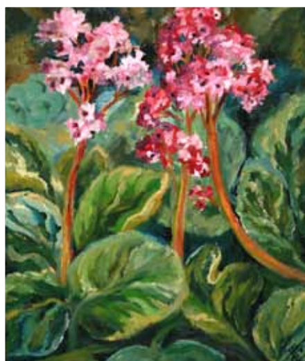
№ 41 Панкова С. Цветы. Х.м. 50x40, 10 000 руб.