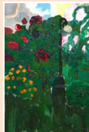
№ 44 Филатова Аня (12 лет), Весна. К.х.м. 35x25, 2 600 руб.