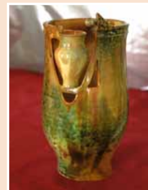
№ 43. Сенюхин В.А. Ваза «Гончар». Террак, эмаль Н – 33, 6 000 руб.