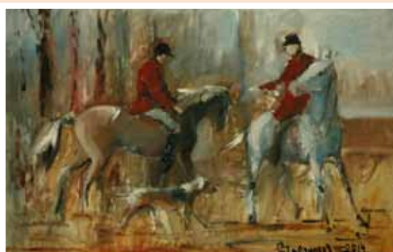
№ 4 Постников С. Охота на лис. Эскиз. Х.м. 50х70, 30 000 руб.