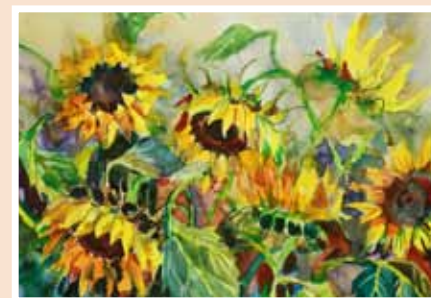
№ 24 Лисовская Н. Подсолнухи. Бум.акв. 28x40, 8 000 руб.